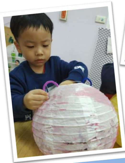
小心的將毛根刺進燈籠