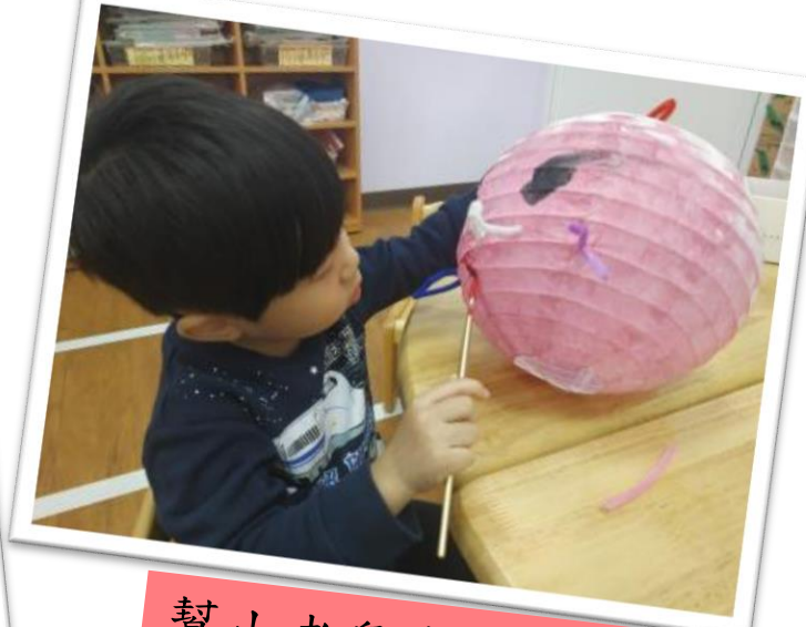
幫小老鼠畫上嘴巴