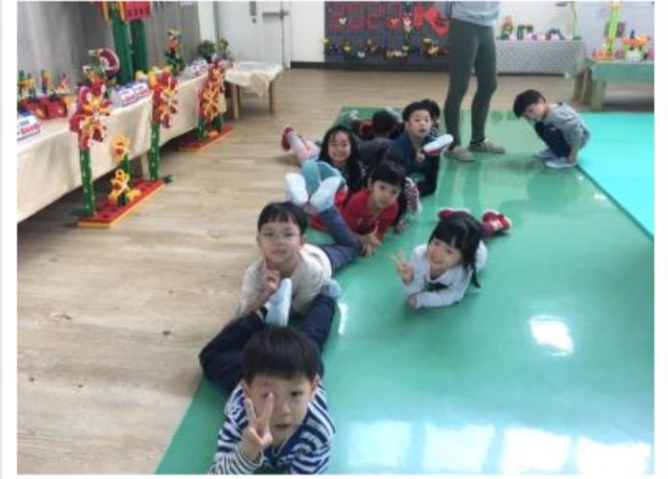
寶貝學習蛇爬行，開心擺出pose