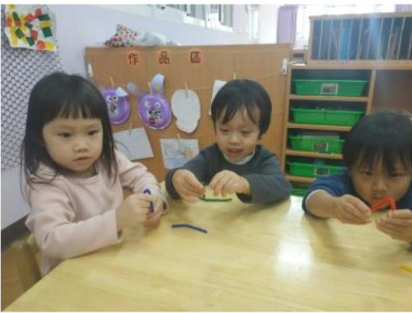
將毛根折彎當作老鼠耳朵