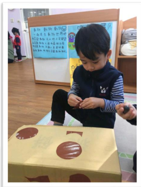
可愛的長頸鹿將完工