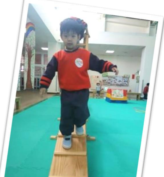
變成無尾熊勇敢爬梯子&走平衡木