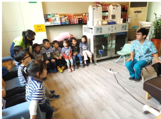
寶貝準備問題發問醫生