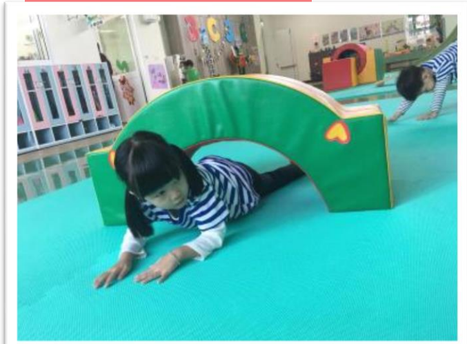
我是獅子勇敢穿過障礙物