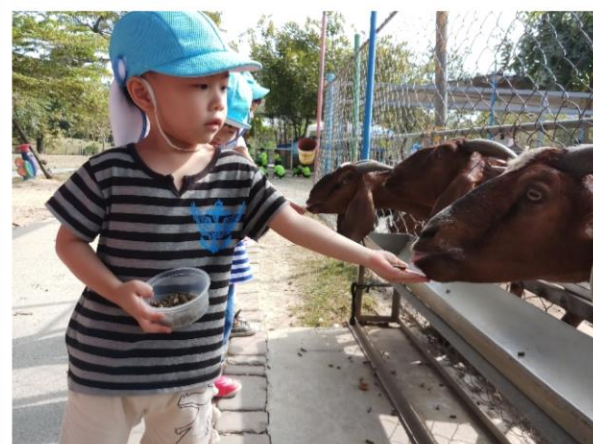
勇敢的將手打開，餵食山羊一點都不可怕