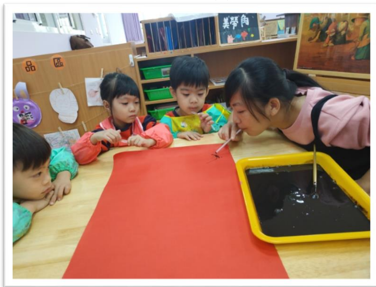
老師示範給寶貝看如何進行吹畫