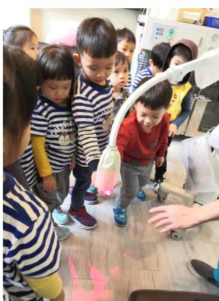
寶貝實際體驗紅外線機，很溫暖呢！