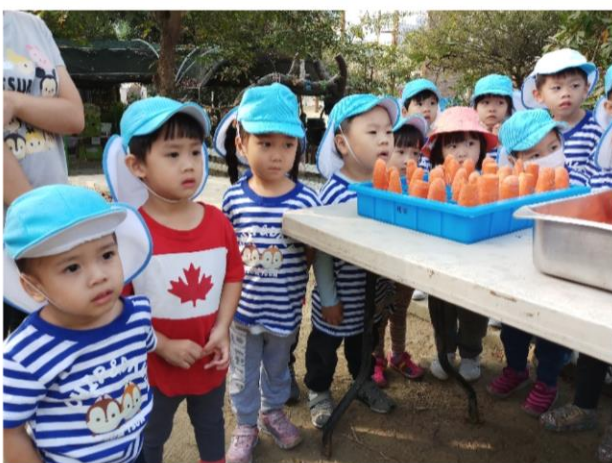
小兔子吃飼料，要吃飽喔!