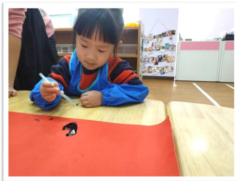
寶貝們努力用吸管將黑色墨汁吹散