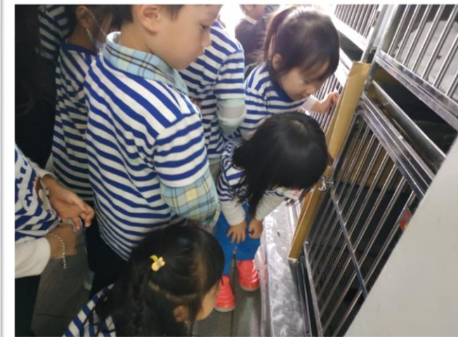
參觀動物們的病房