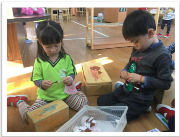
仔細地將卡點西德紙撕下