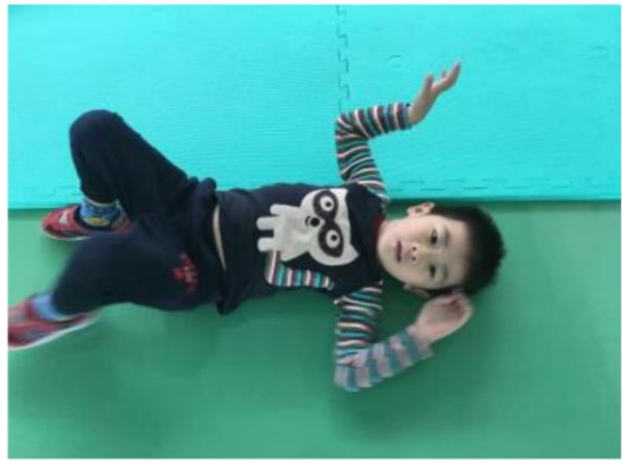
變成游泳高手 - 魚