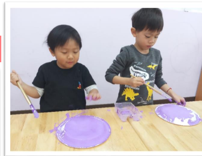
寶貝們也會注意邊邊角角 有沒有塗勻喔！