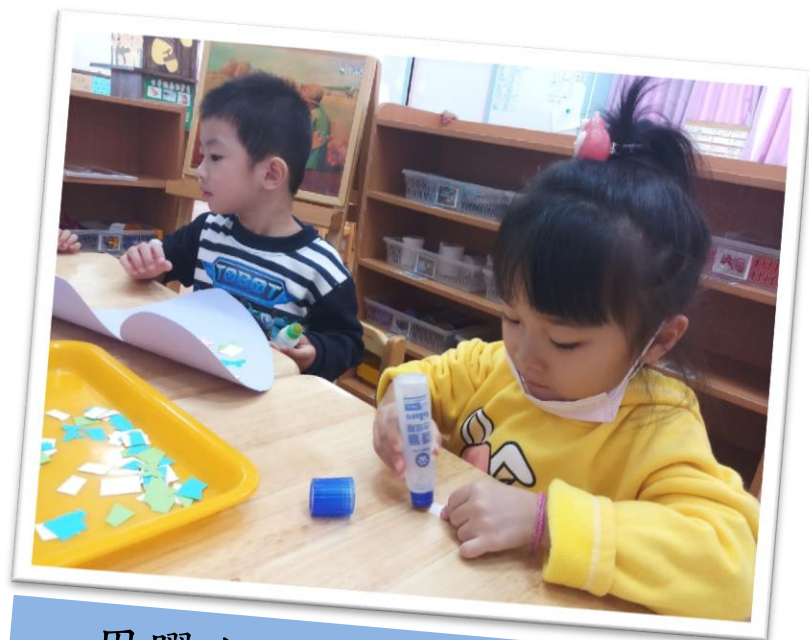
用膠水塗抹碎紙片做裝飾