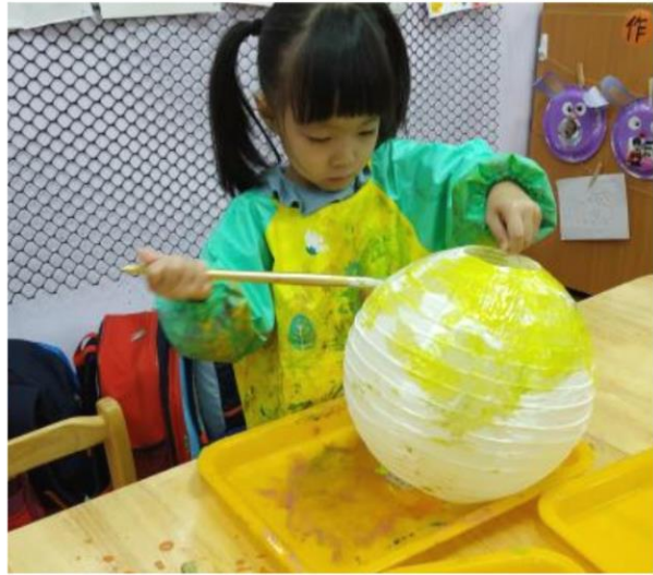
拿起水彩彩繪燈籠