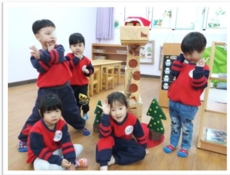
長頸鹿戴上聖誕帽，營造過節氣氛