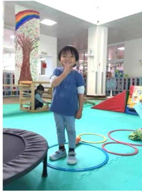
變成跳高高手 - 兔子