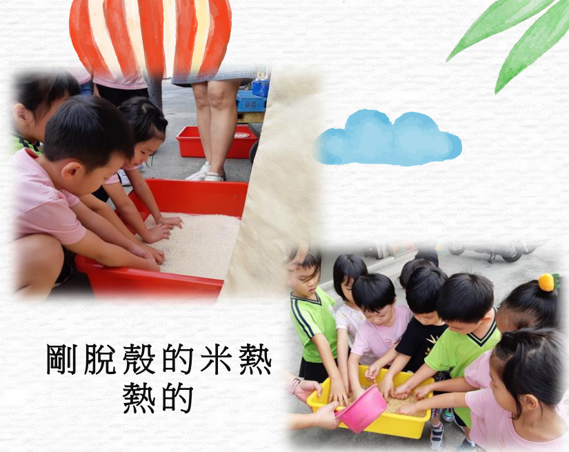
剛脫殼的米熱熱的 熱的