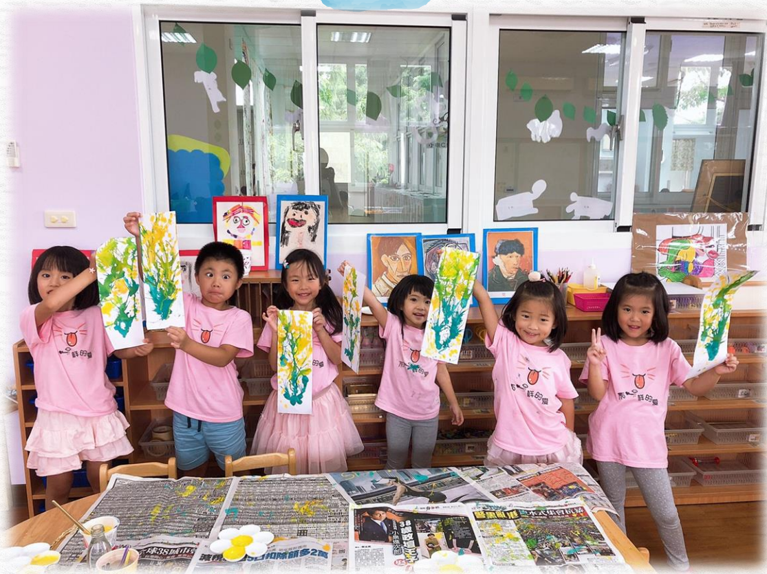
我們的稻穗吹畫都長得不一樣呢!