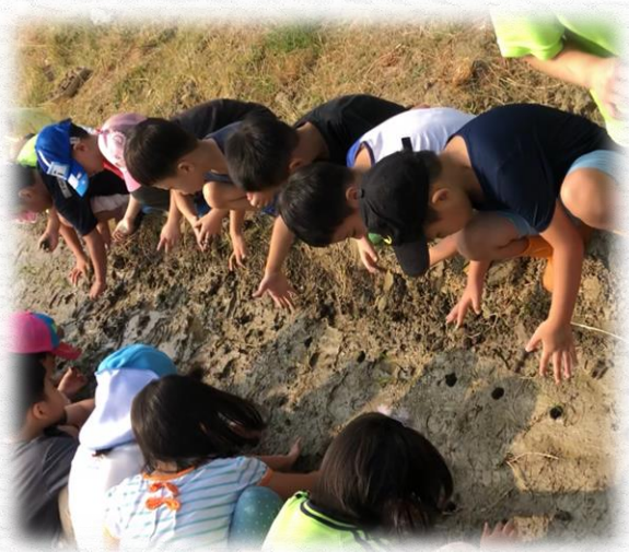
將秧苗種入田裡嘍