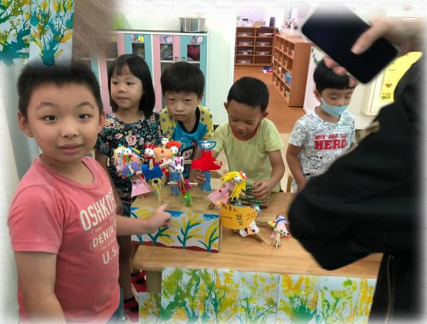
你要一隻稻草人嗎?