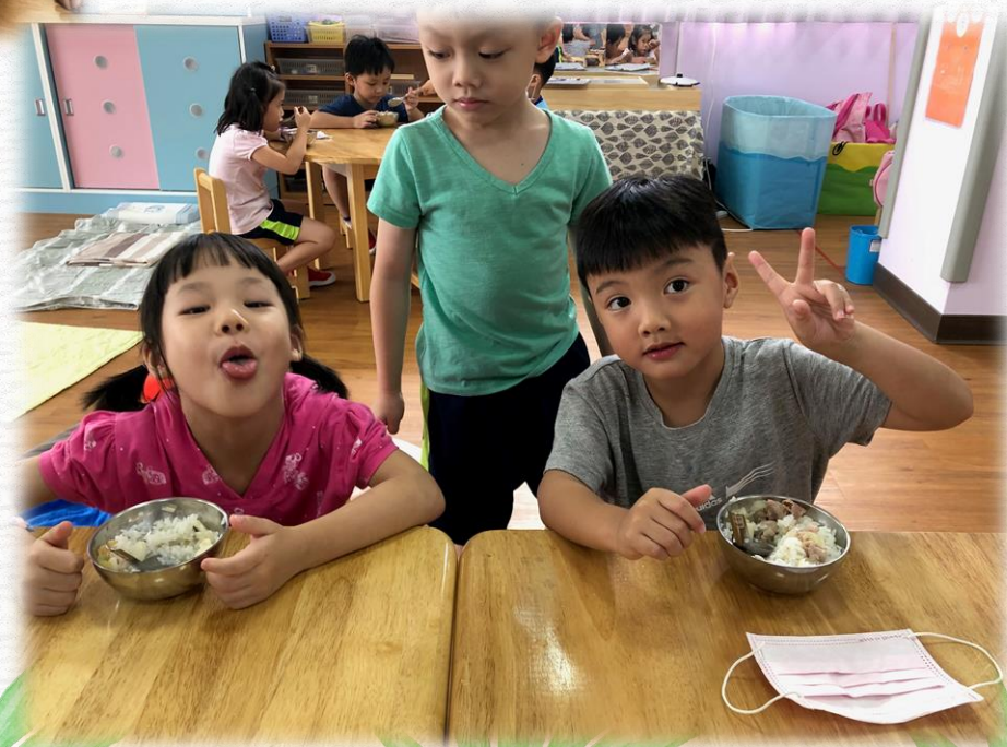
連中餐都要吃自己煮的飯