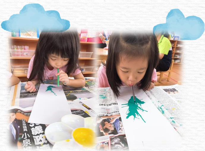
先將綠色的稻桿吹出來