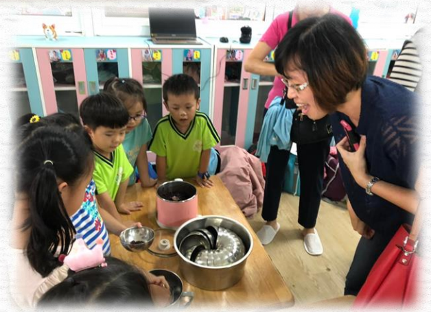
一碗紫米粥怎麼賣？