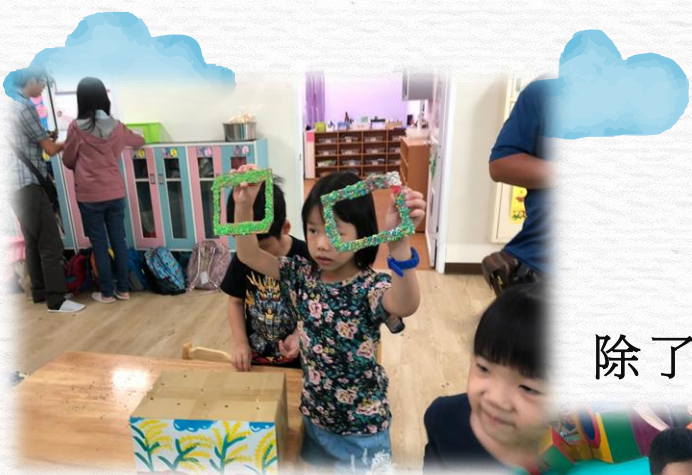
除了稻草人我們還賣相框