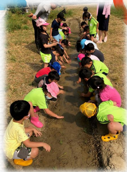
照顧稻田要拔草也要澆水