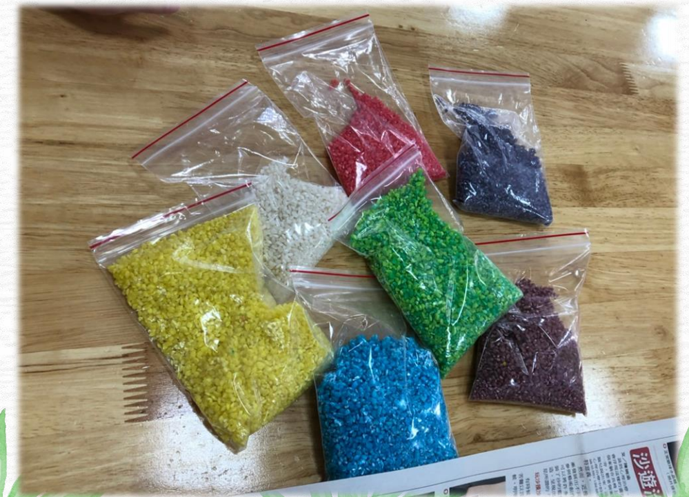
製作完成的彩色米粒，真漂亮