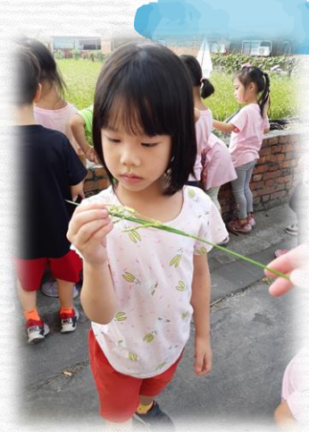
原來稻米還沒成熟時軟軟的