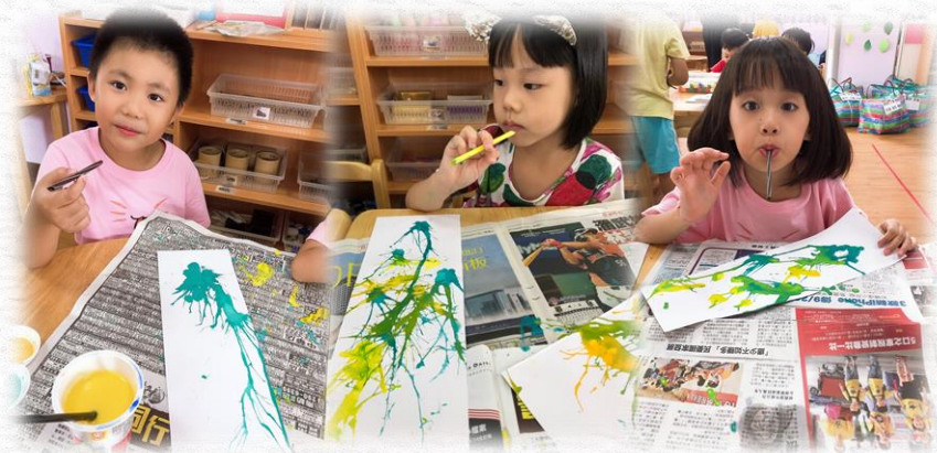
好累喔!讓我休息一下