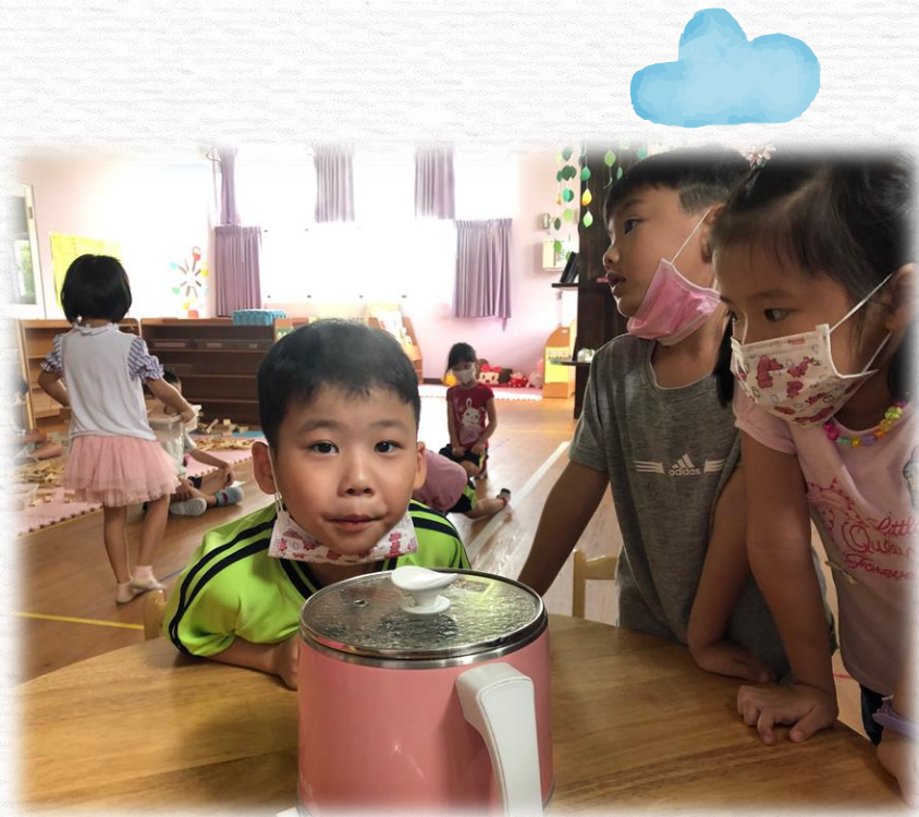
等待白米變成米飯