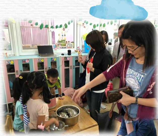
老闆要一碗紫米粥