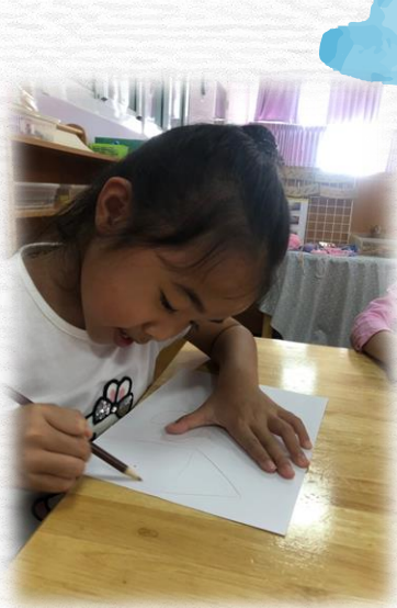
先構圖， 想想我要畫什麼？