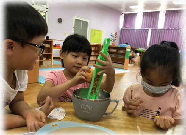
自己將地誇刨成絲