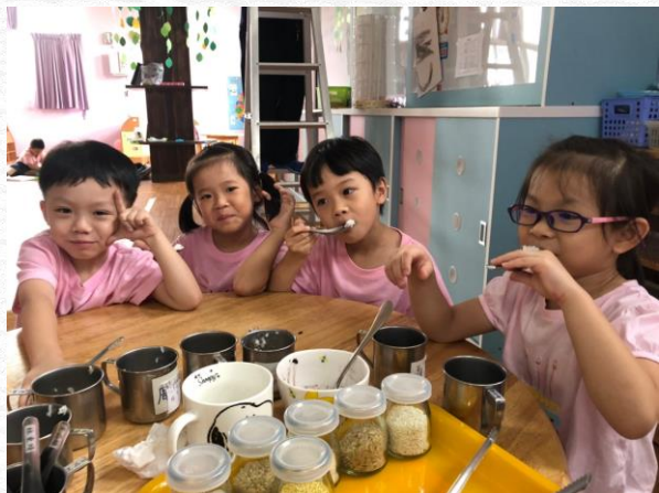
幼兒嚐嚐看米的味道