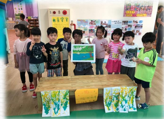
恭喜這位先生得標