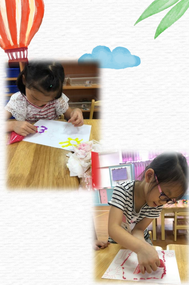
開始利用漿糊進行創作