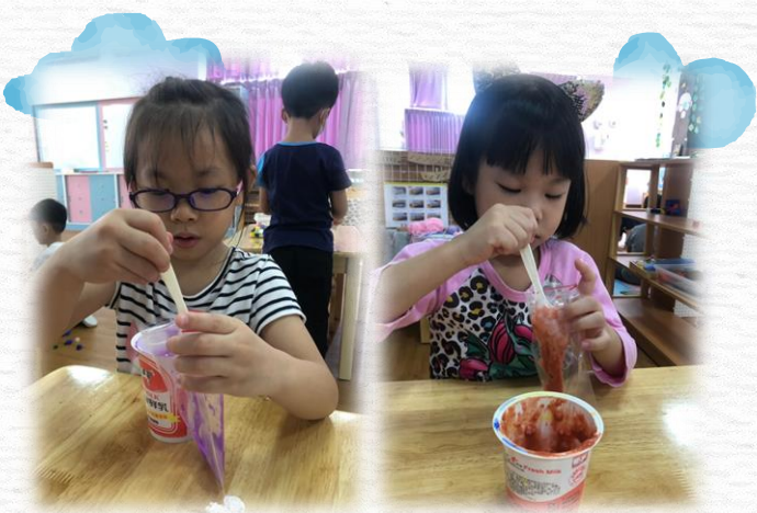
將染好色的漿糊放入夾鏈袋