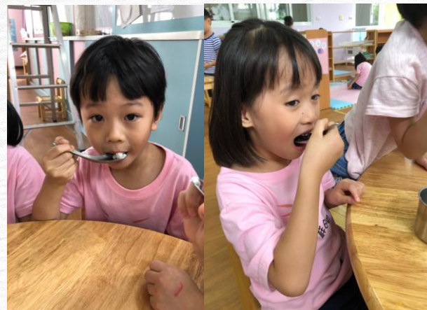
幼兒大口吃米，好好吃喔