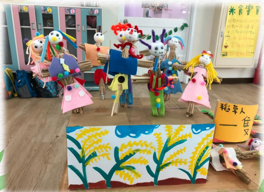
可愛稻草人完成了