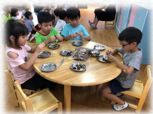
自己將龍眼乾剝殼