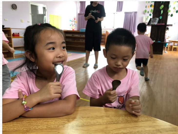
幼兒說出自己的感受