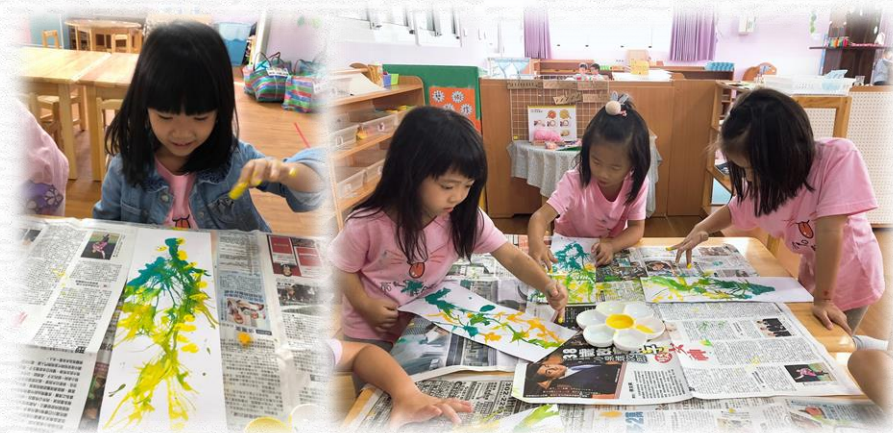
用手點出金黃色稻穗