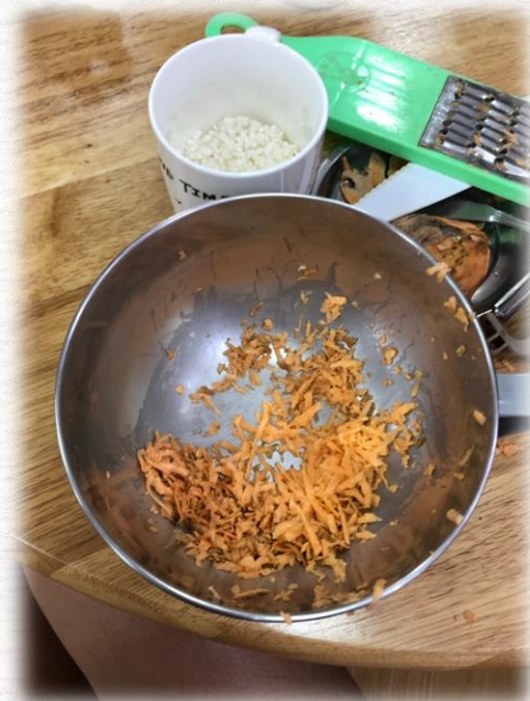
孩子們刨的地瓜絲