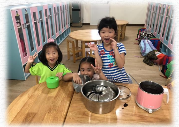
我們是可愛的小老闆