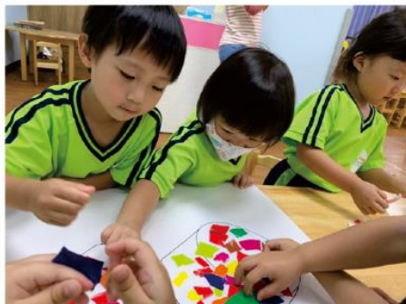
我們來彩繪招牌嘍！

老師發下即將丟棄的色紙讓孩子二次利用來撕碎，並且貼在招牌及冰箱上，使獨特的招牌以及冰箱完成。