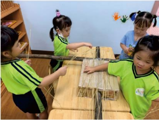
與老師固定好支架、身體後開始黏稻草！