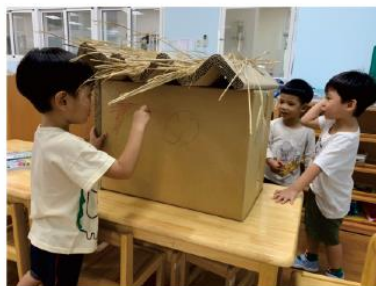
開始認真的彩繪牆壁！