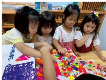
我們一起分工合作！