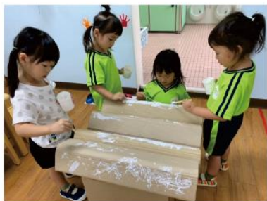
塗上白膠，黏上稻稈！

幼兒動手設計小雞家的屋頂，老師依據幼兒的設計從中協助黏貼，幼兒們相互合作在屋頂上塗上白膠，接著鋪上稻稈裝飾屋頂，再彩繪牆壁。