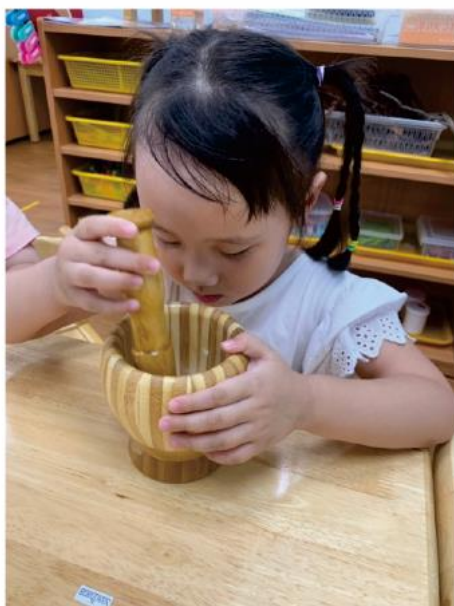
原來磨米這麼辛苦！