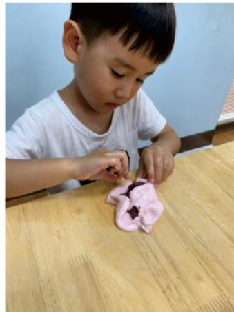
包的動作有點難度！