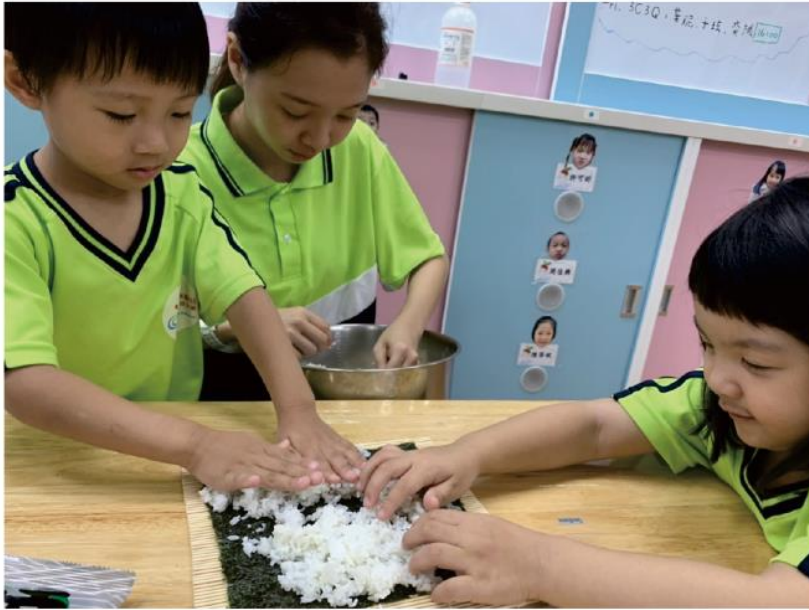
鋪滿好多好多的米飯！