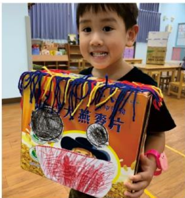
這是我設計的頭喔！