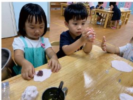
放入自製的紅豆餡。