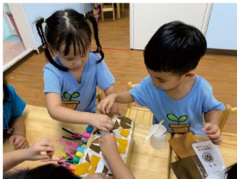
使用不同顏色不織布裝飾盆栽！