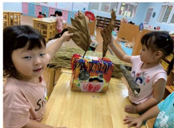
裝上了葉子耳朵變得好可愛！