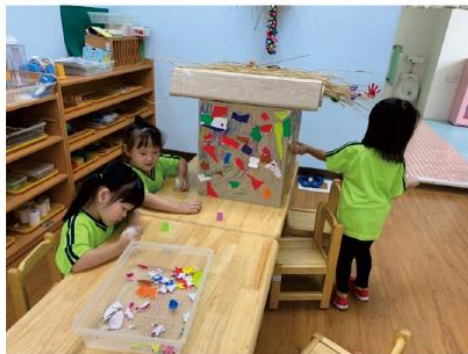
我們貼了好多彩色色塊，因為是我們的雞舍要很漂亮才行！