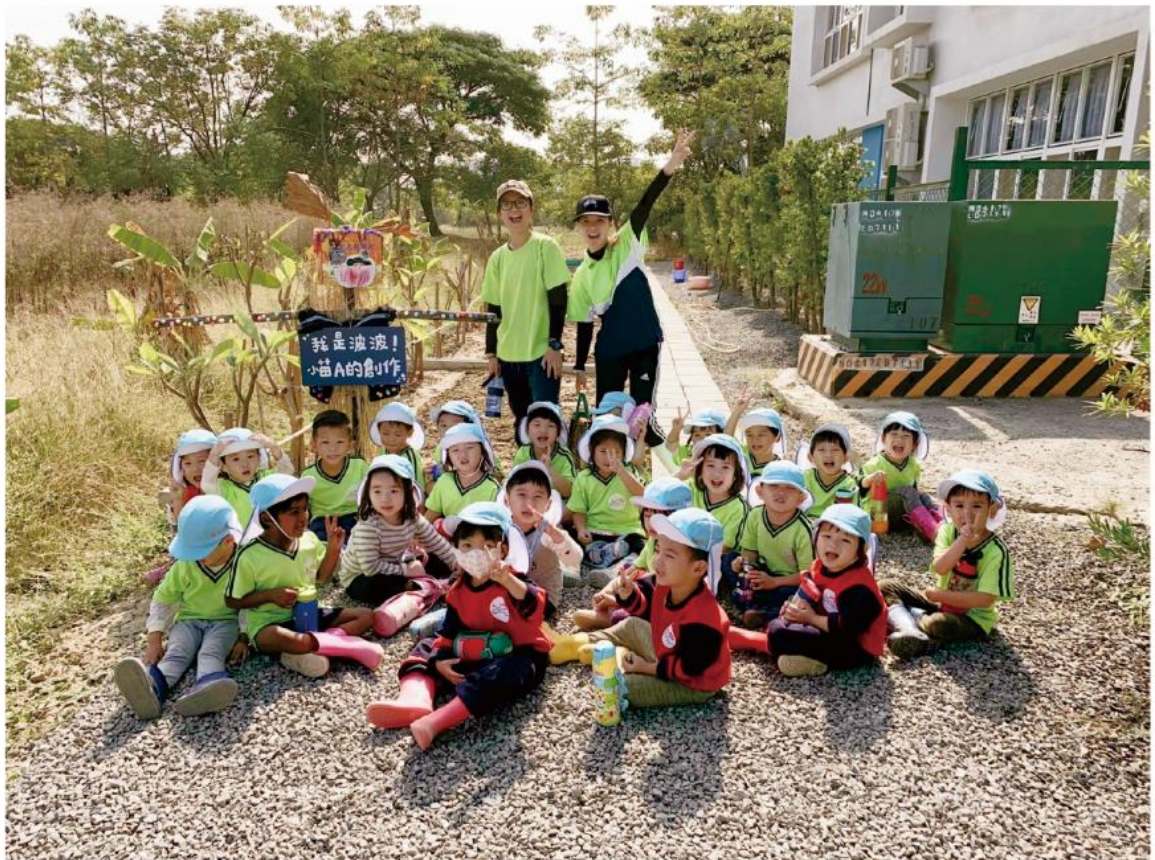
我們做的波波在環境教育中心守護紅蘿波寶寶喔！