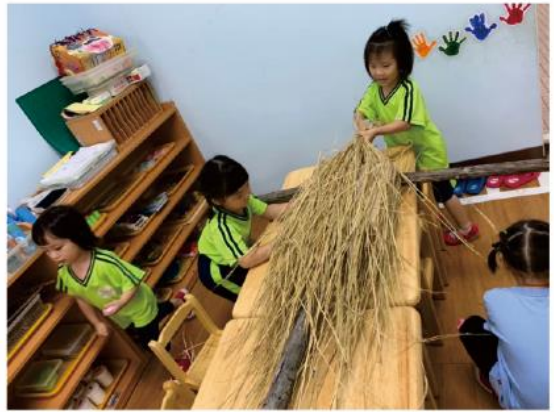
直接放一大把比較快！