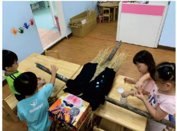
衣服好黑，我們來Color他！