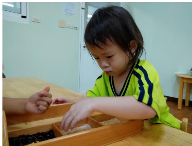
幼兒分辨不同種類的米