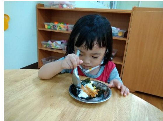
幼兒用湯匙將食材壓平