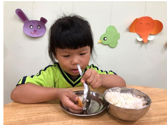
幼兒用湯匙將飯莊進豆皮的洞中