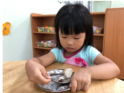
幼兒將搗好的糯米沾上花生芝麻糖粉