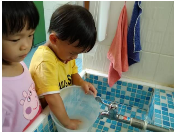
幼兒將水中的米攪和並感受米的質地