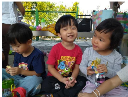
吃著與媽媽昨日一同製作的飯糰