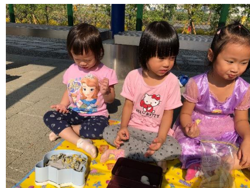
精緻的飯糰搭配著陽光充滿溫馨氣氛