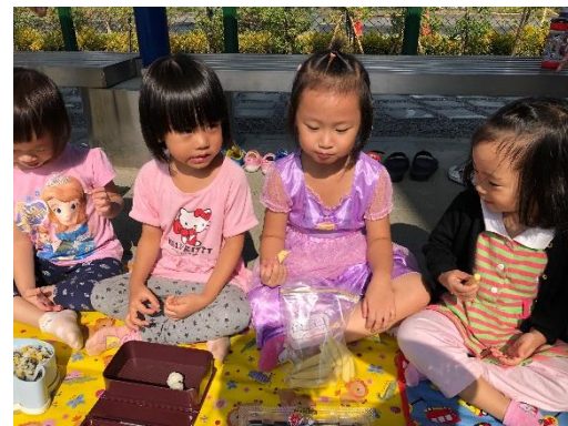
孩子一同分享水果及飯團