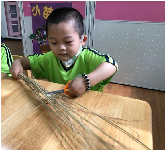
運用剪刀修剪稻草長度

老師詢問孩子這四張圖片中的稻草人有什麼東西（如竹竿、稻草、衣服等）再詢問想用什麼素材進行創作，老師協助提供衣服、稻草、報紙、布，孩子自行將稻草剪裁至適當的長度，老師再協助綑綁。