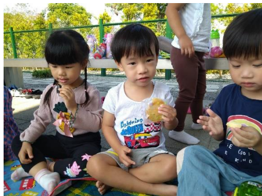
享用媽媽準備的米馬卡龍及米餅