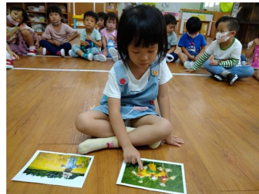
幼兒指出其一稻草人的衣服為塑膠做的