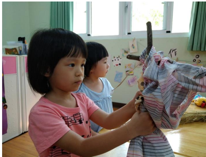
協助將稻草人穿著衣服