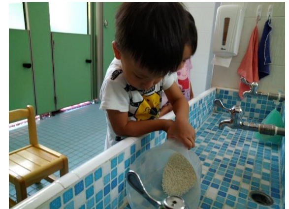
幼兒將攪和完畢後將洗米水倒掉