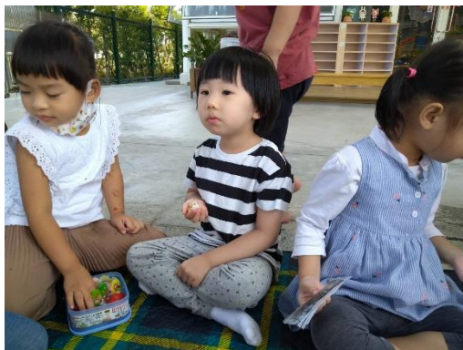
孩子吃著媽媽準備的飯糰及蘿蔔糕