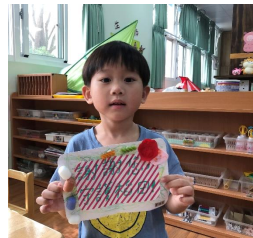
感謝您，守護稻田的感謝小卡