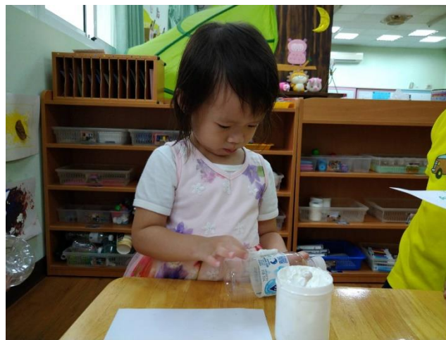
運用寶特瓶製作卡片支架