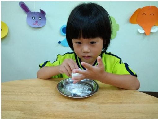
幼兒將搓揉糯米糰

淨手後將已準備好的糯米糰，將糯米糰分成小小塊狀，給孩子們搓揉成條狀，再搓成自己想要的形狀後，將湯圓放入滾水中，再把砂糖、滾水舀進碗中，煮熟的湯圓會浮起來，再把湯圓舀進碗中，這樣湯圓就完成了！過程中讓孩子們體驗搓揉糯米糰，感受黏呼呼的糯米糰，在烹煮時湯圓扶起來時，孩子們很興奮呢！