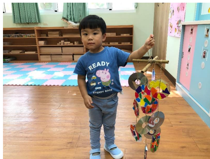
創新光碟片稻草人