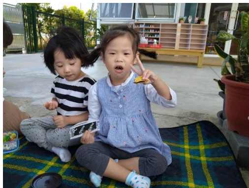
開心地享用餅乾及海苔