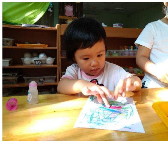
進行拼貼創作卡片