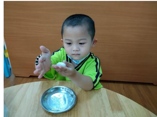
幼兒將糯米糰搓成圓形