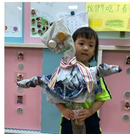
使用瓶蓋、吸管、襪子、布、稻草、木棍所創作的稻草人