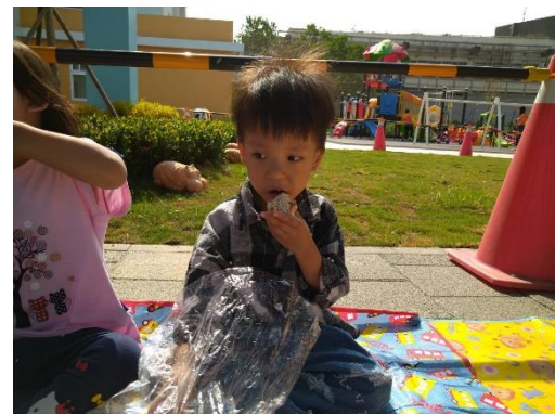
想用爆米香的滋味