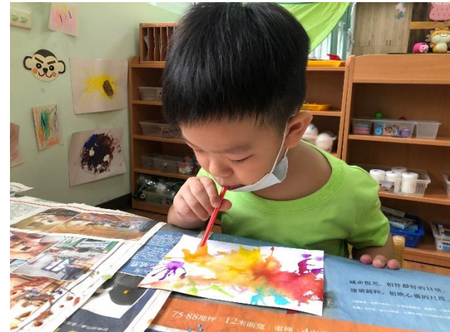
運用吸管吹畫創作卡片