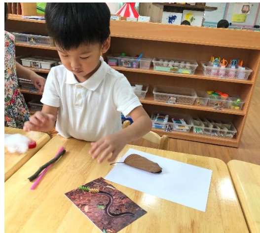
孩子運用義大利麵接起變成蚯蚓身體