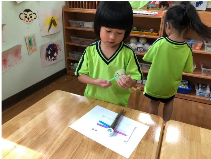
孩子運用樹枝當蜻蜓的身體

老師請孩子拿取素材（如樹枝、乖乖球等）擺放至圖片上，讓孩子發揮自己的想像力進行創作。