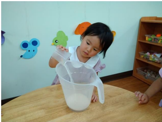
幼兒將量米杯的米倒進容器中

老師先讓孩子們學會用米杯裝米再倒進洗米容器中，再盛水洗米，輪流讓孩子們洗米把水倒掉，最後再倒進容器中放進快鍋烹煮，孩子們洗米時會慢慢地攪和米粒並感受米粒的質地喔！