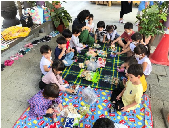
一同分享自己的創意料理

家長和孩子前一日於家人一同製作創意美食，帶至學校和同學一同分享及享用，並於享用的過程中聆聽主題歌曲，孩子一邊吃一邊唱歌，營造歡樂的氣氛。孩子及家長一同用心準備各種米食料理（如：爆米香、飯糰、壽司、玄米茶、米餅等）