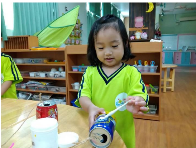
運用棉花黏至鐵罐上進行裝飾

老師和孩子討論完將使用光碟片及鐵罐進行創作，孩子選擇使用色紙撕貼裝飾於光碟片上，也使用棉花、吸管及鈴鐺創作於鐵罐上，孩子一同創造出屬於他們的稻草人。