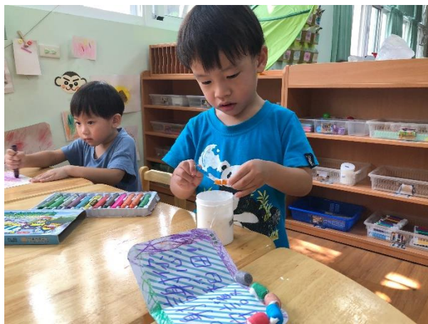
使用義大利麵進行卡片創作

老師讓孩子運用蠟筆於紙上進行顏色創作，再將老師協助寫好的文字黏至自己的圖畫上，孩子可以自行挑選顏色的只進行黏貼，也可自行選用不同的素材（如乖乖球、玫瑰花瓣、義大利麵等）進行創作。