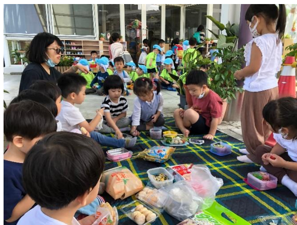
各式各樣的米食料理