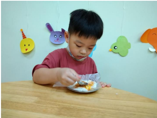
幼兒用湯匙將白飯、肉鬆、玉米壓平

老師準備白飯、肉鬆、玉米與製作飯糰的素材，讓孩子們淨手後，先把盛好的白飯放於盤子上的塑膠膜，在盤子上用湯匙將白飯壓平，再加肉鬆、玉米後，把塑膠膜的四邊拿起，再用手把飯包成飯糰的樣子，這樣飯糰就完成了！孩子們品嚐自己做的飯糰，吃的津津有味！