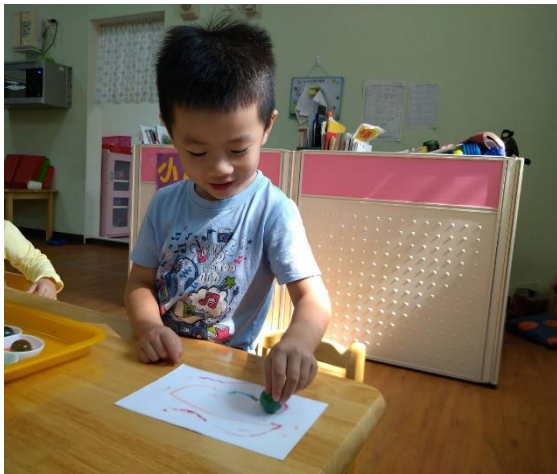
運用彈珠進行滾珠創作

孩子運用撕貼畫、滾彈珠畫及吸管吹畫的方式進行創作，再將老師協助寫好的文字黏至自己的圖畫上，孩子可以自行挑選顏色的只進行黏貼，也可自行選用不同的素材（如乖乖球、玫瑰花瓣、義大利麵等）進行創作。