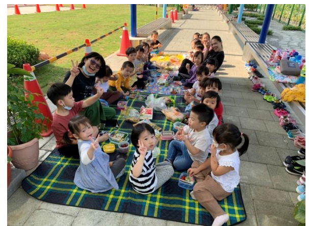
歡樂的創意米食野餐趣