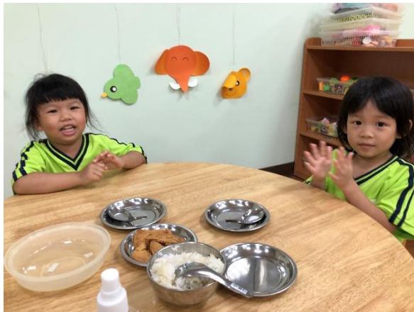
幼兒坐在位置上準備製作豆皮壽司

老師準備米飯、豆皮與製作豆皮壽司的相關素材，孩子們淨手後，先將壽司用的豆皮攤開於盤子上，再將豆皮的洞撐開，把白飯放進洞中，豆皮壽司就完成了！在過程中孩子們體驗並描述豆皮的質地，且運用小肌肉學會將豆皮撐開喔！