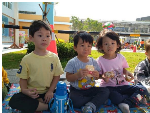
一邊享用餅乾一邊聽主題歌曲