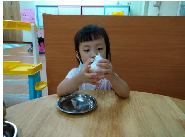
幼兒用手將飯擠壓成飯糰的樣子