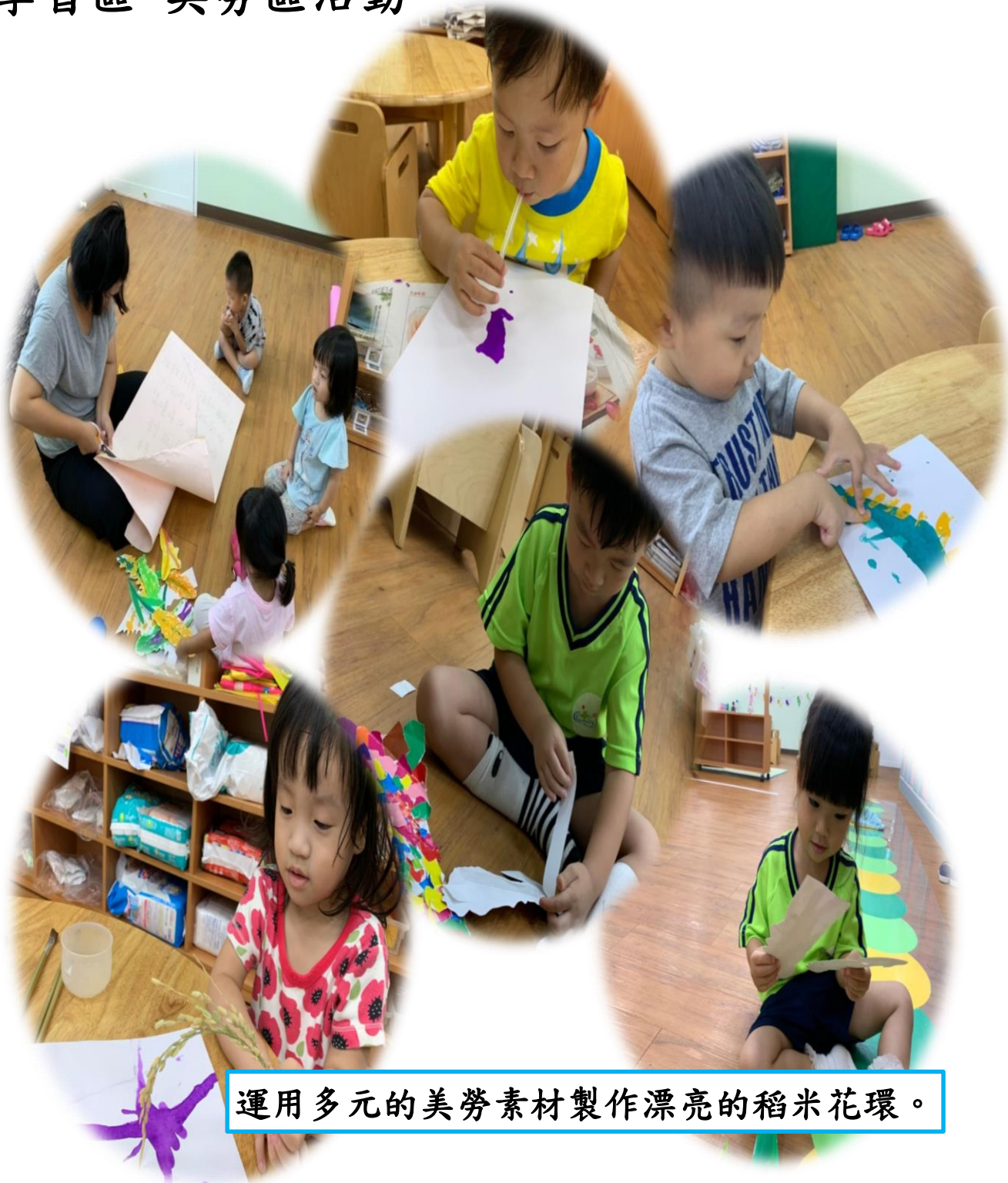
運用多元的美勞素材製作漂亮的稻米花環。